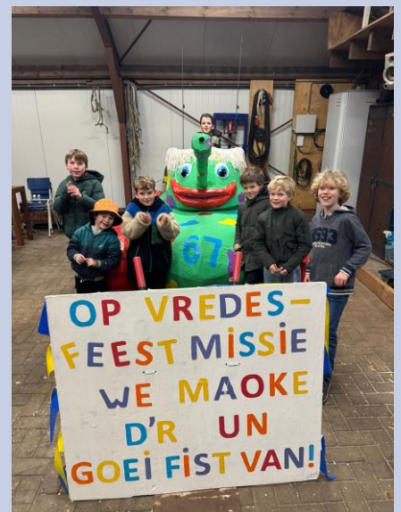
Een kijkje in de bouwschuur van de confettiboy's

Wellicht dat deze boys in de toekomst op een echte vredesmissie (moeten) gaan, maar voor nu gaan ze op feestmissie. Met hun confetti-tank hebben ze er zin in om er een mooi feest voor iedereen van te maken. Zij maken dat ze het goed maken.”