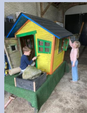
Er wordt flink gebouwd door CV Sunsjein