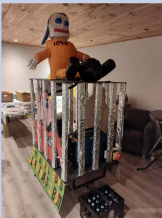
CV de Rielboys