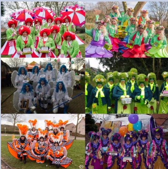
De Riels Angels door de jaren heen

“De Rielse SugerBabes zèn op zuuk naor unne nuwe SugarDaddy. Dees Rielse vrouwkes maoke ut goed, mar hèbbe ut te bont gemòkt. Den deze mokt ut daordur nie lang mir! Dus wij zèn op zuuk naor unne nuwe, die ut goed gemòkt heej in ut lèève en un bietje zwoel èut zunne smoel kèkt.”